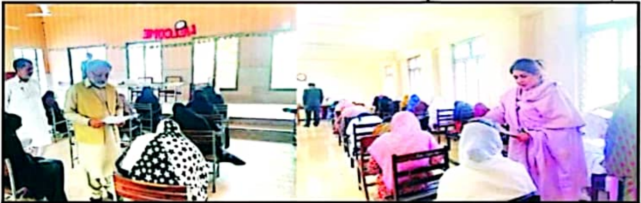
ڈاکٹر صفیہ سلطانی ڈپٹی سیکرٹری ہائر ایجوکیشن ڈپارٹمنٹ حکومت پنجاب نے کنٹرولر امتحانات پروفیسر ساجد محمود فاروقی کے ہمراہ امتحانی سنٹر کا دورہ کر رہی ہیں