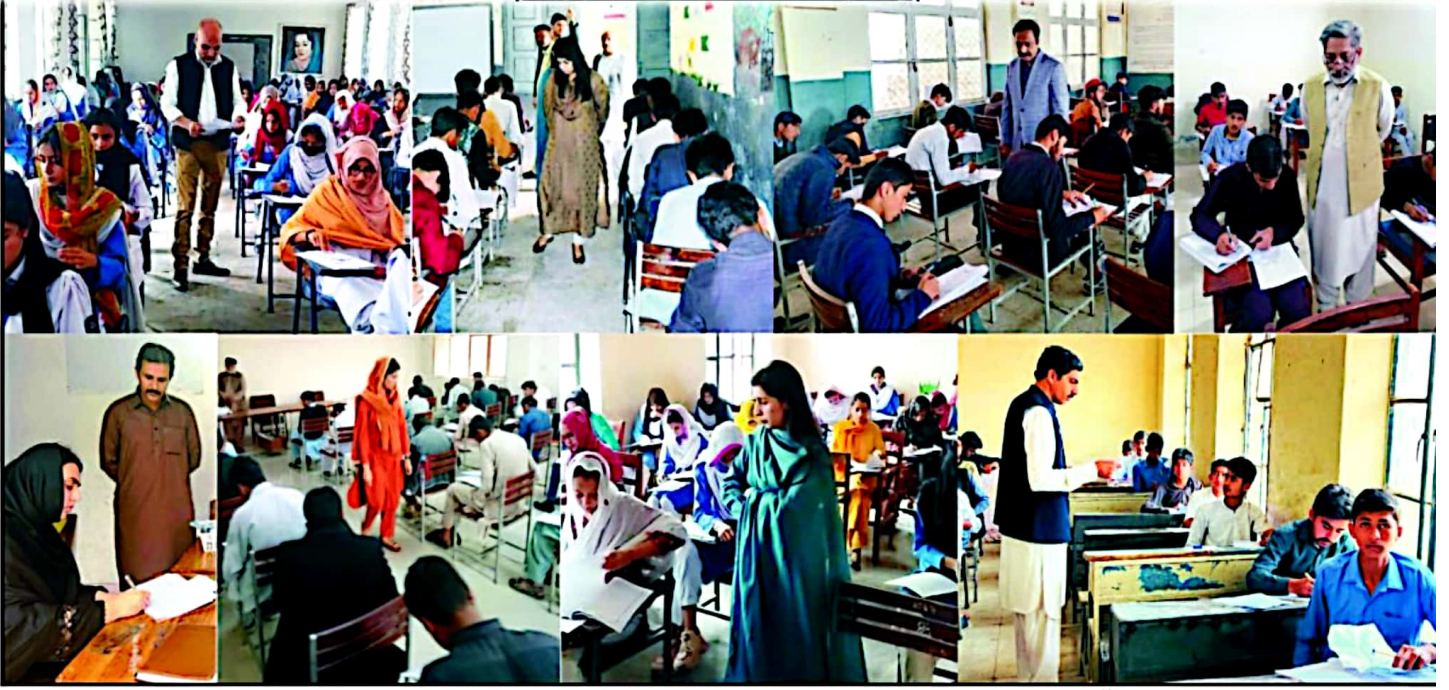
راولپنڈی، چیئر مین تعلیمی بورڈ محمد عدنان خان، پروفیسر ساجد محمود فاروقی و دیگر مختلف امتحانی مراکز کا دورہ کرتے ہوئے