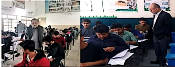
چیمبر میں تعلیمی بورڈ راولپنڈی محمد عدنان خان اور کنٹرولر امتحانات پروفیسر ساجد محمود فاروقی امتحانی مراکز کے دورہ کرتے ہوئے

راولپنڈی (نمائندہ خصوصی) چیمبر میں تعلیمی بورڈ راولپنڈی محمد عدنان خان اور کنٹرولر امتحانات پروفیسر ساجد محمود فاروقی کے امتحان انٹرمیڈیٹ سیکنڈ اینول 2023 کے مختلف امتحانی مراکز کے دورے چیمبر میں تعلیمی بورڈ راولپنڈی محمد عدنان خان نے کہا کہ راولپنڈی تعلیمی بورڈ کے زیر انتظام ڈویژن بھر کے مختص مراکز میں امتحان انٹرمیڈیٹ پارٹ ٹو سیکنڈ اینول 2023 کا سلسلہ جاری ہے۔ بورڈ ہذا کے ذمہ داران نے امتحانات کے پراسن اور شفاف انعقاد کے لیے خصوصی اقدامات اٹھائے ہیں۔ اور صاف شفاف امتحانات کا انعقاد یقینی بنانے کی ہر ممکن کوشش کی گئی ہے۔ اس سلسلے میں بورڈ کے افسران اور خصوصی آپکشن ٹیمیں امتحانی سنٹروں کا اچانک دورہ کر کے صورتحال کو مانیٹر کر رہے ہیں۔ کنٹرولر امتحانات پروفیسر ساجد محمود فاروقی نے گورنمنٹ ڈگری کالج ڈھوک کالا خان، گورنمنٹ کپہری ہیلو پوائنٹ ہائی سکول ڈھوک کشمیریاں، گورنمنٹ کپہری ہیلو گرلز ہائر سیکنڈری سکول ڈھوک کشمیریاں اور گورنمنٹ گرےجویٹ کالج (باقی صفحہ 3 بقیہ نمبر 18)