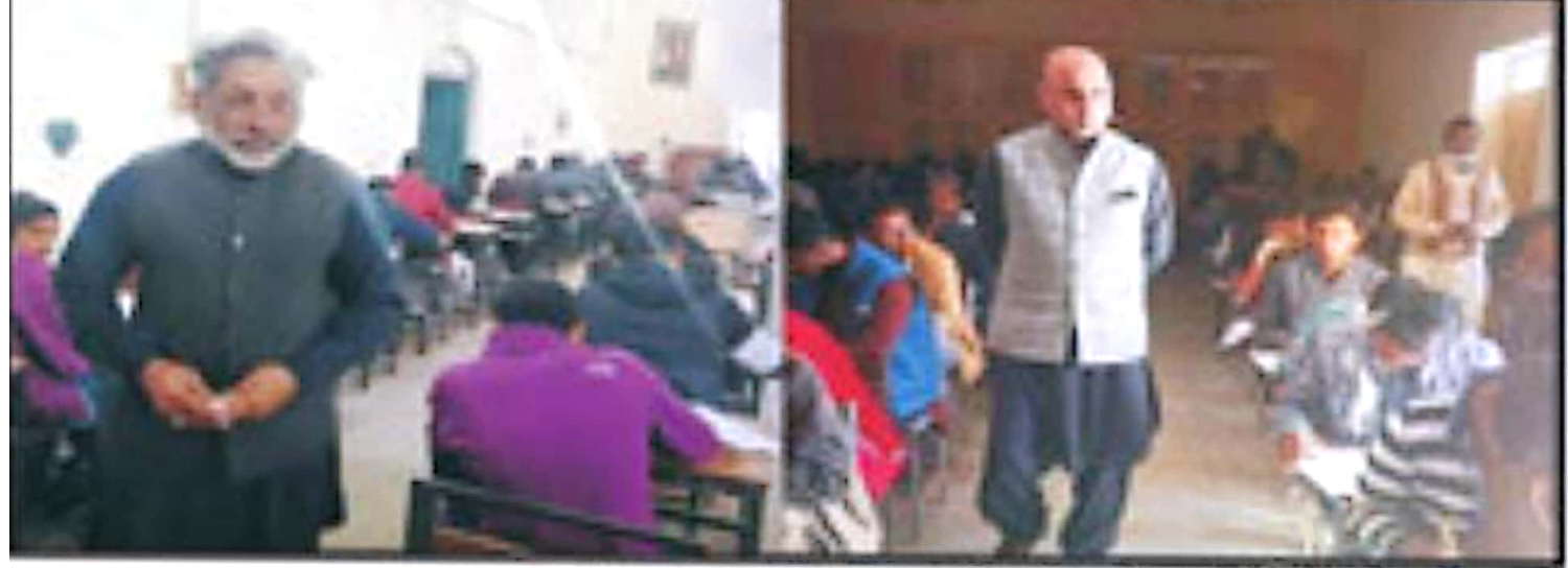
چیئر مین تعلیمی بورڈ راولپنڈی اور کنٹرولر امتحانات امتحانی مراکز کا دورہ کر رہے ہیں۔