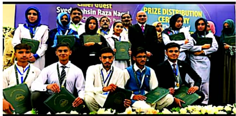
راولپنڈی، تعلیمی بورڈ کے امتحان میٹرک فرسٹ اینول 2023 کے پوزیشن ہولڈرز طلبہ و طالبات کا چیئر مین تعلیمی بورڈ عدنان خان کنٹرولر امتحانات پروفیسر ساجد محمد فاروقی، سیکرٹری بورڈ پروفیسر آصف حسین کے ہمراہ گروپ فوٹو

جلد: 07 ہفتہ 12 اگست 2023ء صفحات: 4 قیمت: 10 روپے شمارہ: 146