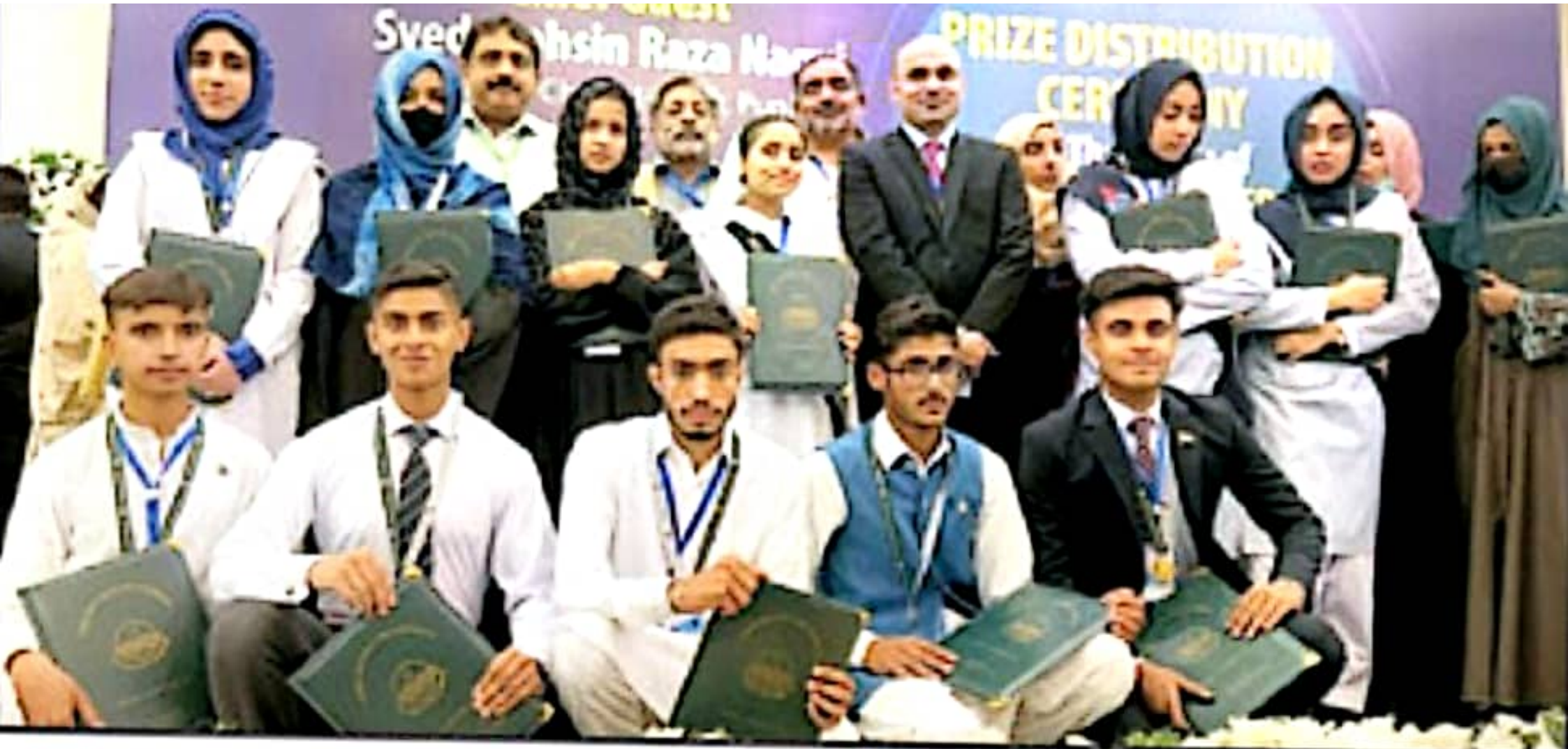
راولپنڈی: میٹرک امتحانات کے پوزیشن اول انڈر طلبہ کا میٹر من تعلیمی بورڈ و دیگر کے ہمراہ گروپ فوٹو۔