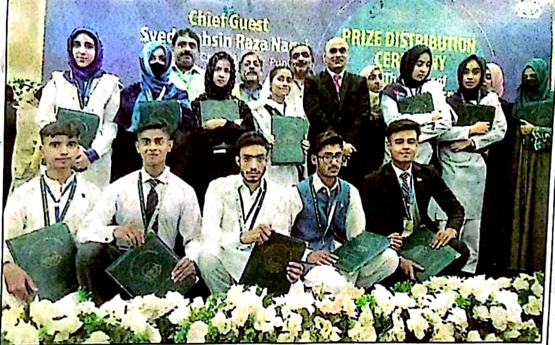
راولپنڈی، میٹرک امتحان میں پوزیشن ہولڈر طلبہ و طالبات کا چیرمین تعلیمی بورڈ عدنان خان کے ہمراہ گروپ فوٹو