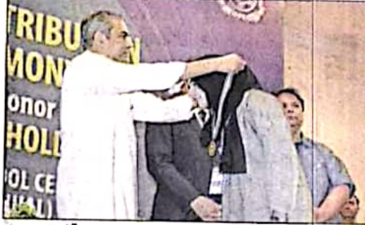
لاہور: وزیر اعلیٰ میٹرک امتحانات کے پوزیشن ہولڈرز میں گولڈ میڈل و اسٹانڈنگ ایم کر رہے ہیں

حق نہیں سوجتا ہے، پاکستان کو بہتر بنانے کے کام میں حصہ ڈالنا ہمارا فرض، وزیر اور بیورو کر سکی بہترین کام کر رہی پاکستان میں مسائل کی کوئی کمی نہیں، پوزیشن ہولڈرز طالب علموں کی تعلیمی معاونت جاری رکھیں کی بنگران وزیر اعلیٰ