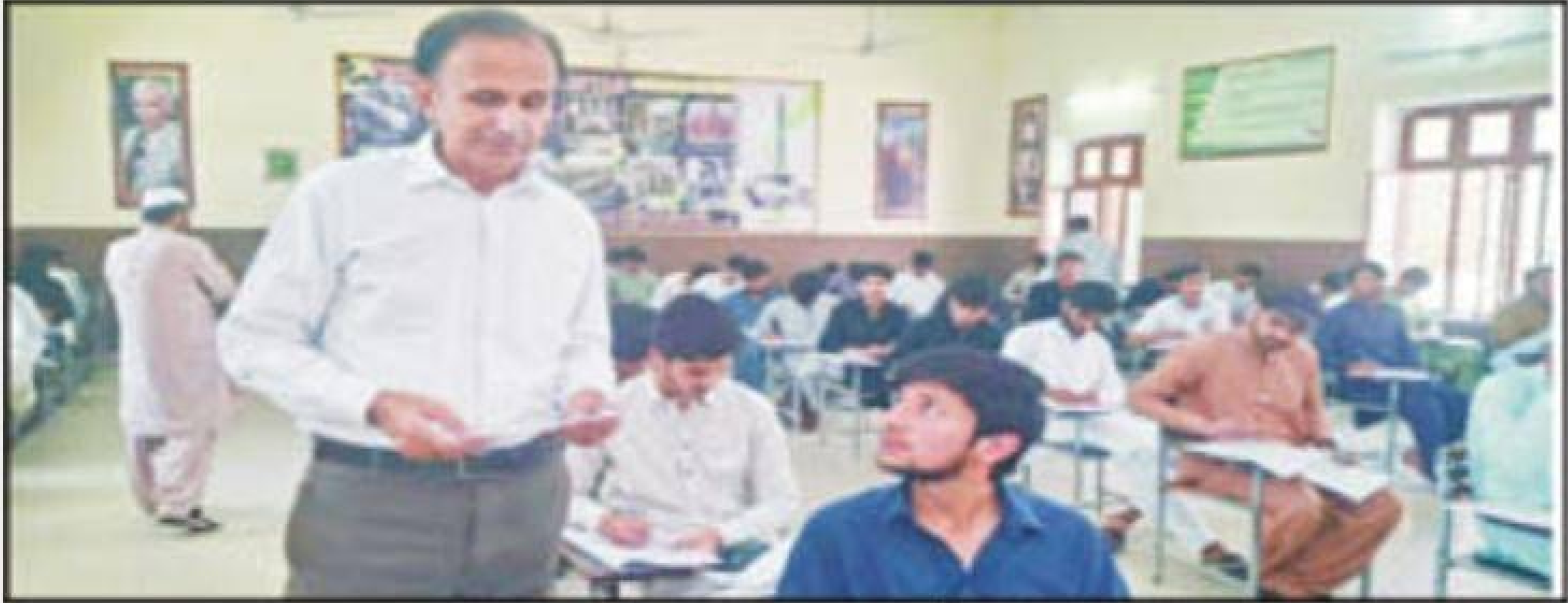
راولپنڈی، کنٹرولر امتحانات تعلیمی بورڈ جنوبہ صوبہ اہم امتحان مراکز کا دورہ کر رہے ہیں